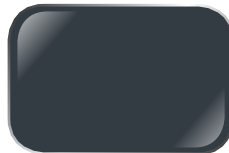
XÁM GR11 Neptune Grey