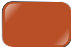
CAM OR11 Action Orange