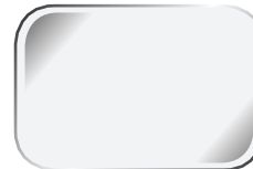
TRẮNG WH11 Brahminy White