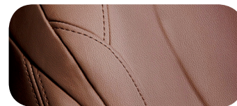
MÀU NÂU Saddle Brown