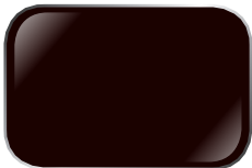
NÂU BR11 Cormorant Brown