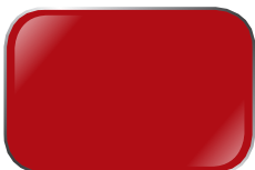
ĐỎ RE11 Mystique Red