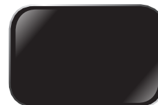
ĐEN BL11 Jet Black