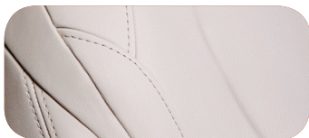
MÀU BE Light Beige