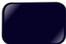
XANH BL11 Luxury Blue