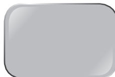
BẠC SI11 De Sat Silver