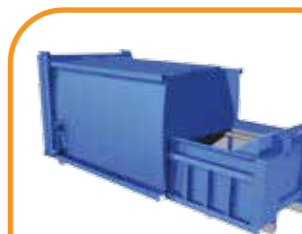
Thùng ép và chở rác Garbage compacting container