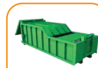
Thùng chở bùn Mud carry container