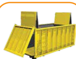
Thùng chở rác Garbage carrying container