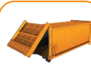
Thùng chở rác Garbage carrying container